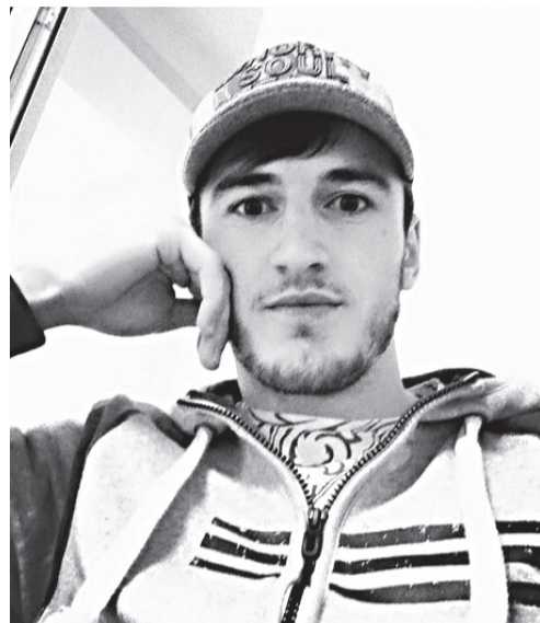
жеги рохизаризе ратила Шамилица жеги чІахІиял бергъенлгъабаз.

Гъедин Шамиль вахъана Россиялгул чемпионлгун. Баркула ЛъаратІа районялда нильер ракъоцясул кудиял бергъенлги ва гъарула Шамилие щулияб сахлъигун халатаб гьумро. Ниль