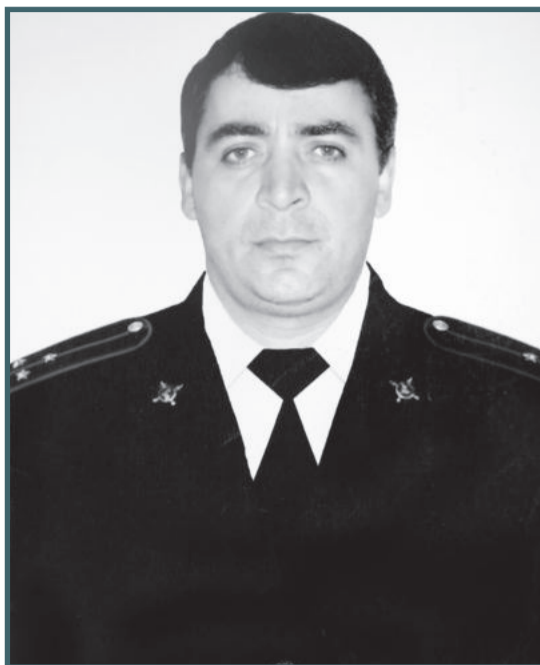
Россиялгь Рамазан дур цIар ахIилин, Гьелгьий цакав гьечIо, шулага лъала.

Гумрудул сонал дур гIемер рукIинчIо, ГIадамаз кIалалгь мун рехсананиги.