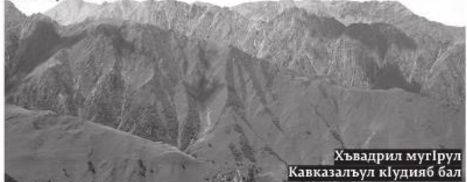
Хъвадрил мугIрул Кавказалзул кIудияб бал