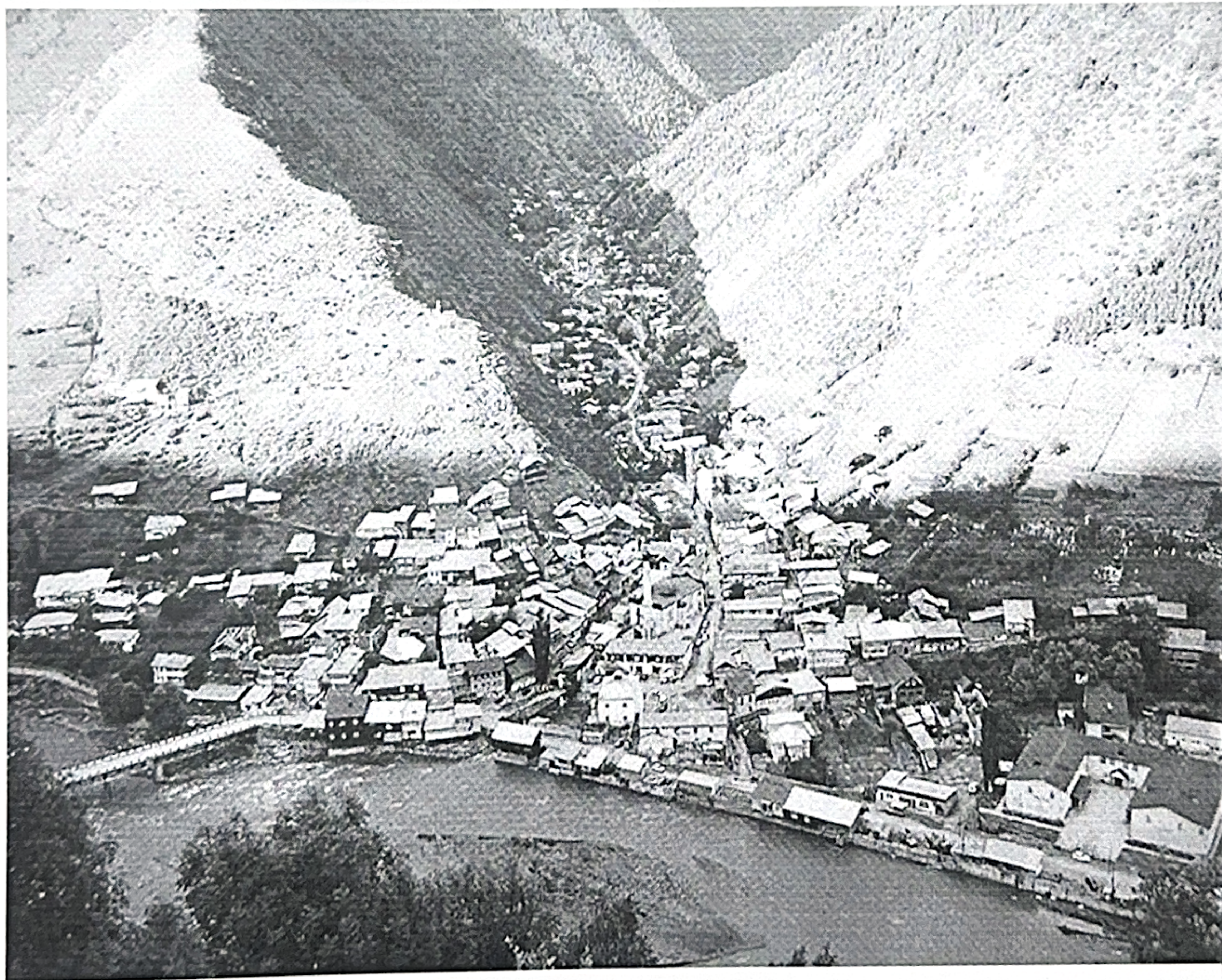
с. Тлярата 2024 г.